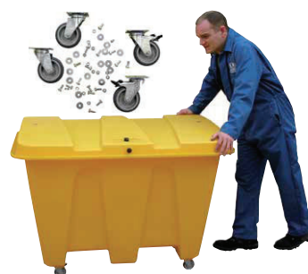
JBS500-COYE + KIT103